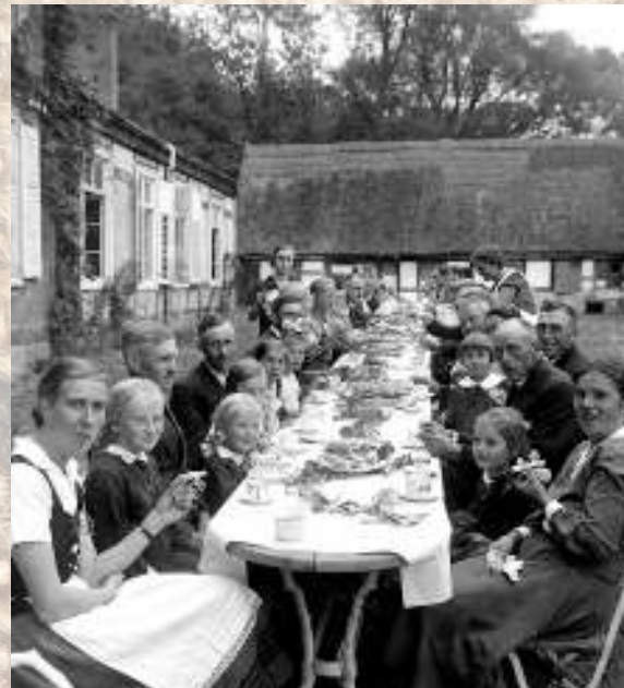
Erntedankfest in Plänitz, 1934

Der Focus liegt auf der bislang unberücksichtigten Rolle des ländlichen Raums in der historischen Aufarbeitung. Die Lebensleistung einzelner Familien, Schicksale, Unternehmen und Betriebe, Biographien besonderer Persönlichkeiten dieser Geschichtsepoche sollen gewürdigt werden.